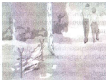
Разведение костров, поджигание сухой травы (палы)