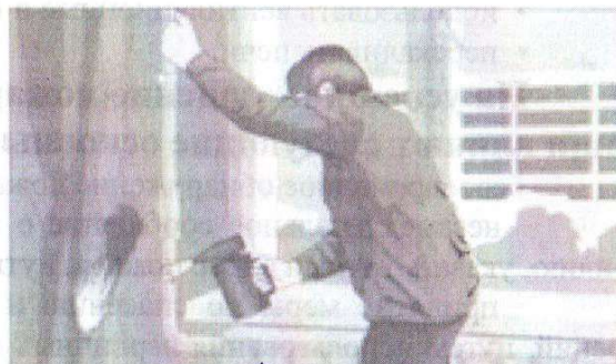
Нарушение правил проведения сварочных работ

- топить углем, коксом и газом печи, не предназначенные для этих видов топлива;