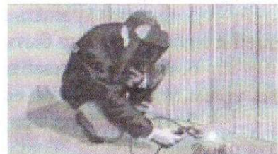
Нарушение правил проведения сварочных работ

· применять для розжига печей бензин, керосин, дизельное топливо и другие ЛВЖ и ГЖ;